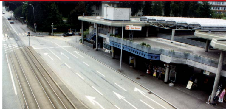
Wabern Zentrum 1996

In dieser Tagung werden namhafte Experten Beispiele und Strategien präsentieren, wie eine am menschlichen Maß orientierte Stadt- und Verkehrsplanung die nachhaltige Sicherung von Lebensqualität in unseren Städten konkret erreichen kann.