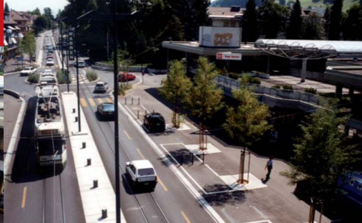
Wabern Zentrum 1997