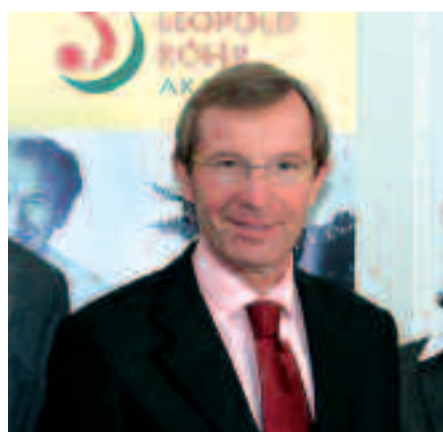
Landeshauptmann-Stv. Dr. Wilfried Haslauer unterstützt die Aktivitäten der Leopold Kohr-Akademie und des Kulturvereines TAURISKA im Land Salzburg.

Herr Landeshauptmann-Stellvertreter Dr. Wilfried Haslauer, in Ihr Arbeitsgebiet fallen auch die „Kulturellen Sonderprojekte des Landes Salzburg“, die 2009 viele Veranstaltungen Leopold Kohr widmen. Hatten Sie einen persönlichen Zugang zu Kohr?